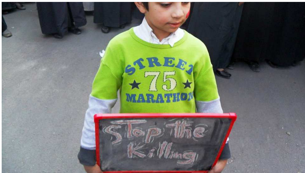
Ein kleiner Junge bei einer Demonstration in Daraya, südwestlich von Damaskus. (25. April 2011)